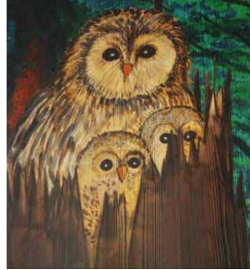
Neue Entdeckerwand für Kinder ab dem Vorschulalter im Haus zur Wildnis

Auch unter den Käfern finden sich im Nationalpark Bayerischer Wald 15 Urwaldreliktarten. Wiederum Grund: der totholzreiche Waldbestand. Außerdem kommen seltene Pilze wie die Zitronengelbe Tramete oder der Duftende Feuerschwamm vor – eine deutschlandweit einmalige Situation, denn sie wachsen nur dort, wo besonders urtümliche Bedingungen herrschen.